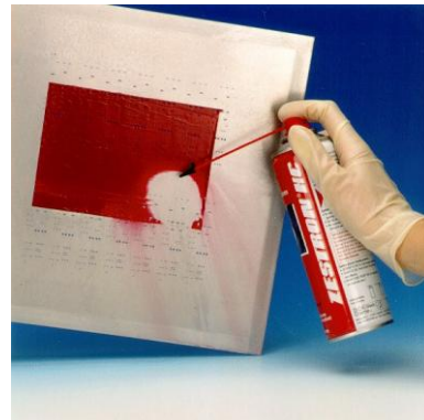
Reinigung von Kleber auf Schablonen mit ZESTRON® HC