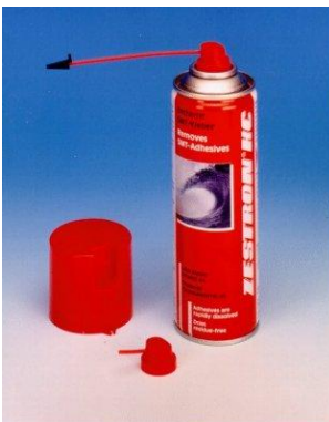
ZESTRON® HC Sprühdose

Vor der Reinigung von Kunststoffteilen bitte unser Technisches Infoblatt 3 einsehen.